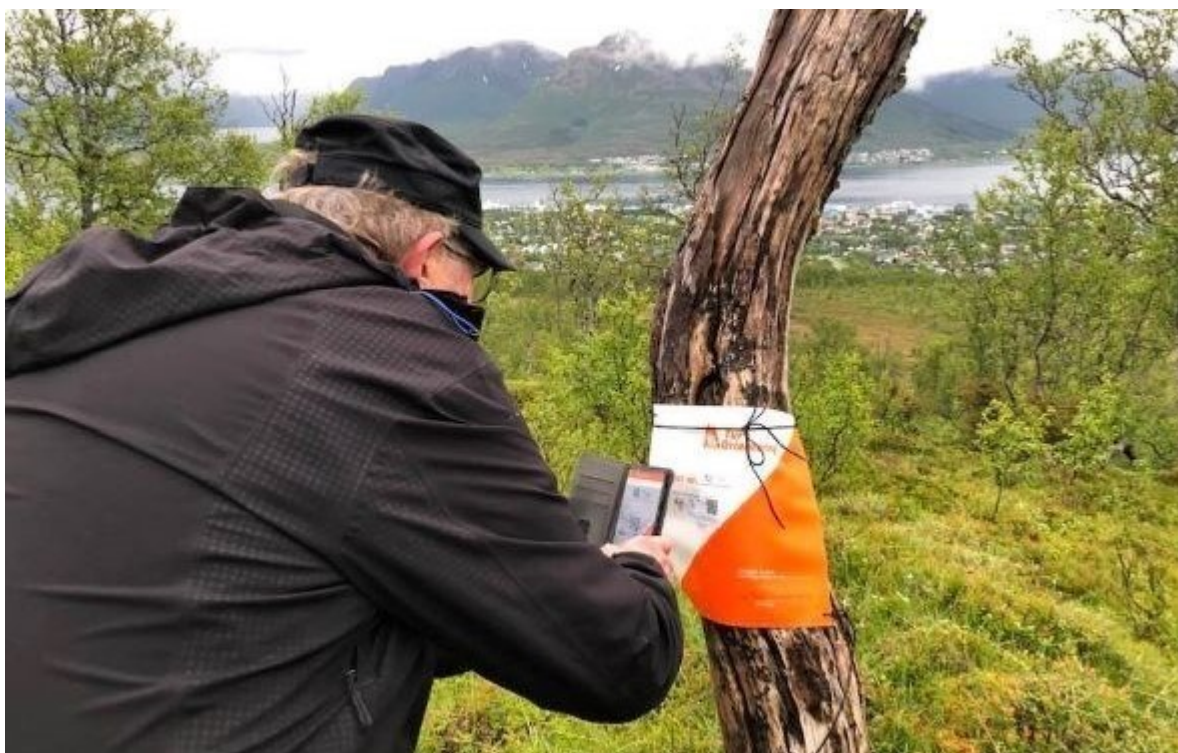
De fleste benytter digital registrering av poster på tur-o.

Vi går for det meste flere i lag, så det blir også sosialt med kaffepause og brødskive. En hyggelig måte å bli bedre kjent. Vi avrundet tur-o før sommerferien med mat på Thai-restauranten også i år, der 10 stk møtte.